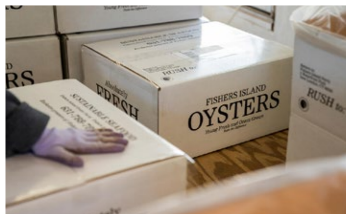
Cassette monouso in cartone.

Cassetta monouso in cartone ondulato: tale cassetta è monouso ed è costituita da una struttura di cartoncino ondulato, che fornisce resistenza meccanica e agli urti, accoppiato ad un film sottile in PE, che permette un contatto temporaneo con gli alimenti umidi, conferendo caratteristiche idrorepellenti. Tale cassetta consente, inoltre, di risparmiare spazio nelle fasi di trasporto e di stoccaggio a terra e a bordo perché è pieghevole e viene quindi spesso consegnata e conservata prima dell'utilizzo in fogli piatti. Le scatole pieghevoli sono anche facili da riciclare e in molti Paesi sono accettate nel flusso di carta/cartone. Negli ultimi anni in Europa, a seguito degli interventi normativi sulla plastica, il tasso di riciclo degli imballaggi in fibra è in crescita rispetto a quello degli imballaggi in plastica 80,81 . Tale soluzione è stata sottoposta ad analisi LCA 82,83 , anche nel contesto di piccola pesca all'interno del progetto WWF Italia (disponibile su richiesta).