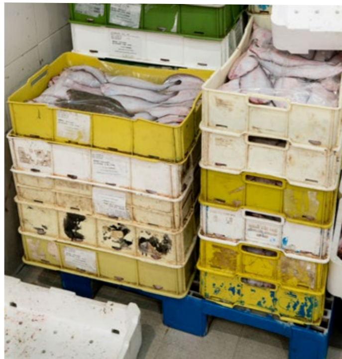
Cassette riutilizzabili in plastica dura.

sulla base di sistemi di pooling , ovvero sulla condivisione e sul riutilizzo delle risorse della catena di fornitura tra i pescatori all'interno della marineria, del mercato ittico o della cooperativa a cui afferiscono. In alcuni casi la cassetta è di proprietà di un fornitore di servizi di noleggio che è responsabile della consegna agli utilizzatori, ma che non è ne-