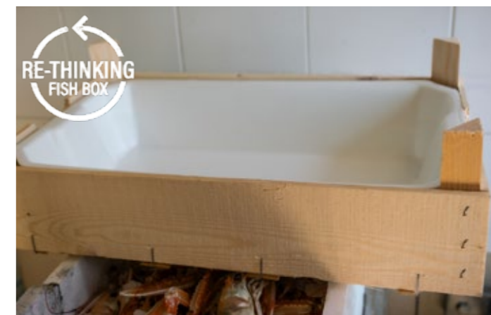
Cassette in legno riutilizzabile con vassoio interno monouso in XPS riciclato.