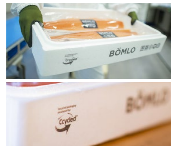
Cassetta monouso in EPS riciclato.

una cassetta per il pesce in EPS riciclato da post consumo adatto al contatto con gli alimenti, che deriva da tecnologie di riciclo chimico 78 . Tale soluzione è stata sottoposta ad analisi LCA per la piccola pesca all'interno del progetto Re-thinking Fish Box 79 di WWF Italia (disponibile su richiesta agli autori).