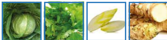
Cavolo Cappuccio Sedano Indivia Topinambur

SEMINA: aglio bianco, cavolo cappuccio, crescione, fave, lattughe da taglio, melanzane, meloni, piselli, pomodori, peperoni, ravanelli, sedano.