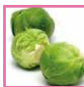
Cavoletti di Bruxelles