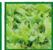
Lattughino da Taglio

SEMINA: angurie, asparagi, basilico, bietole, carciofi, carote, cavoli, cicorie, cipolle, indivia, fagioli, fagiolini, finocchi, lattuga, meloni, melanzane, peperoni, piselli, prezzemolo, ravanelli, rucola, sedano, spinaci, valeriana, zucche, zucchine.