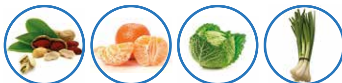
Frutta secca Mandarini Cavolo Verza Porri

FRUTTA: arance, cachi, castagne, frutta secca, kiwi, limoni, mele, mandaranci, mandarini, pompelmi.